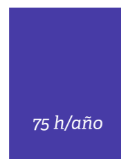
Solución Sage SII Básica

* Gestionando 500 facturas al mes / 2 envíos semanales / coste-trabajador 18 €/h